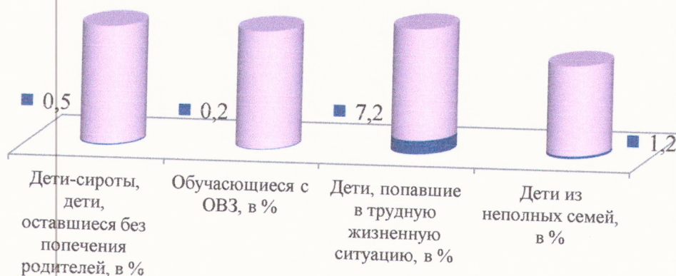
Рис. 1. Социальные характеристики контингента обучающихся.

Исходя из учета разнородности социального состава обучающихся в МАУ ДО ЦДТ «Радуга талантов» выстроена социальная политика, направленная на создание условий для обучения и воспитания детей из семей «группы риска», попавших в трудную жизненную ситуацию, детей с ОВЗ. С целью ее реализации разработаны следующие направления: